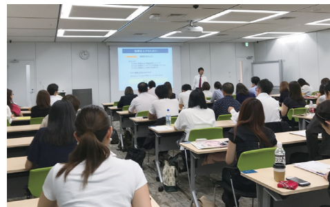
販促やマーケティングのご担当者さまに人気です

危機感を感じている企業にこそオススメの、新規顧客開拓の事例や法則が満載のセミナーです (1社3名様まで無料です)