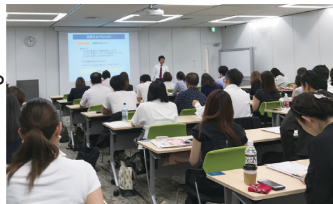
過去セミナーの様子

実は、失敗と成功の事例を比べてみるとパターンがあり、成功パターンには必ず「ある工夫」があったのです。